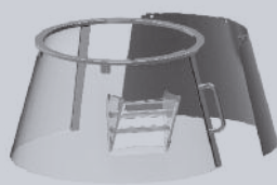
Protezione fissa/girevole in plastica "F" Fixed rotating plastic safety guard "F"